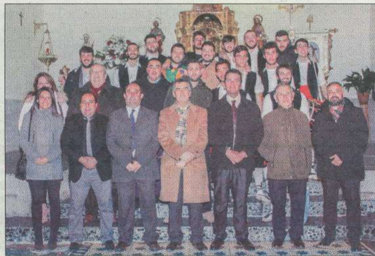
Autoridades y políticos arroparon la celebración de la fiesta.