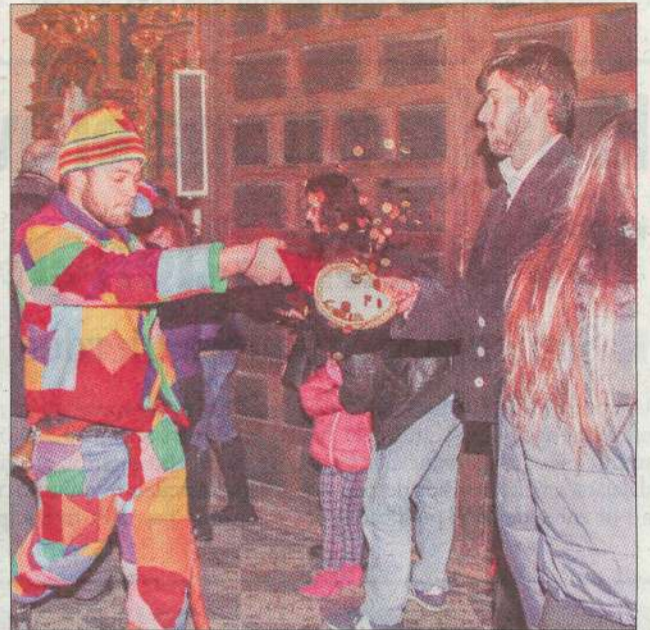
El botarga molesta durante la recolecta en la iglesia.