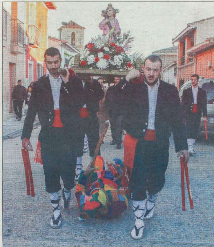
El botarga se pone bajo la imagen del niño en la procesión.

Actualmente la provincia de Guadalajara cuenta con 20 Fiestas de Interés Turístico Regional. Cuatro de ellas han sido declaradas como tal durante la presente legislatura. En concreto el primer año de legislatura se declaró el Certamen de Rondas Tradicionales de Torija y este mismo año se han aprobado las declaraciones del Maratón de Cuentos de la ciudad, de la Fiesta del Niño Perdido de Valdenuño Fernández y la Cabalgata Aérea de Alarilla.