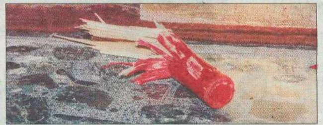
Es habitual que los palos se rompan durante el paloteo