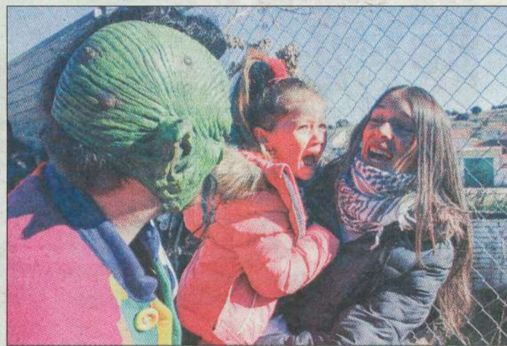
Una de las niñas, asustada por la botarga de Valdenuño.