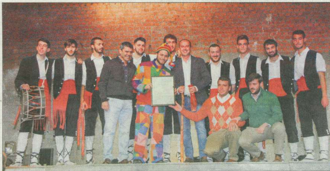
Entrega del reconocimiento de Fiesta de Interés Turístico Provincial.

El domingo por la mañana, el buen tiempo se unía a la celebración y la localidad se llenaba de vecinos, visitantes asiduos y curiosos que se acercaban por primera vez a una fiesta que va camino de cumplir los 300 años de vida. "Según los documentos que tenemos, data de 1721", señala el primer edil.