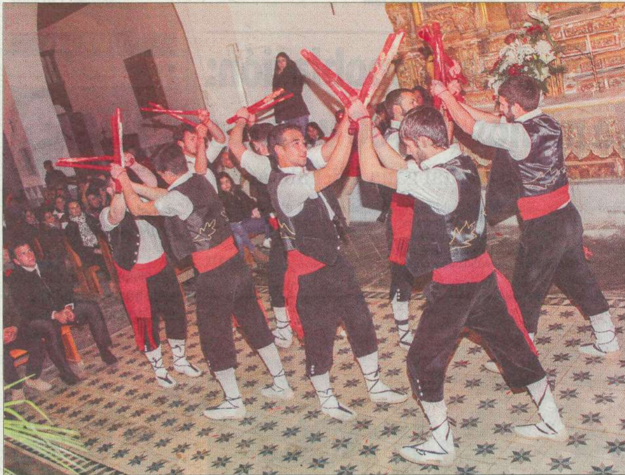
El paloteo, uno de los momentos más espectaculares de la fiesta.