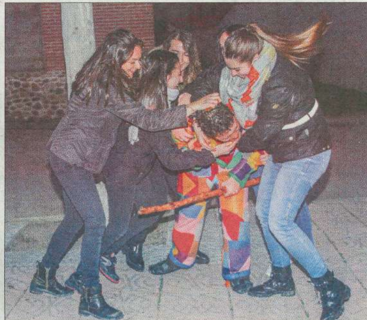
Jóvenes del pueblo hacen pagar al botarga sus constantes molestias